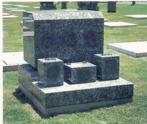
Cタイプ C TYPE grave