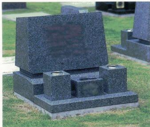
Bタイプ B TYPE grave