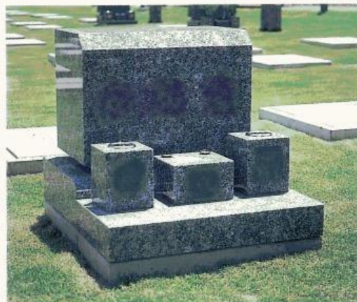
Cタイプ C TYPE grave