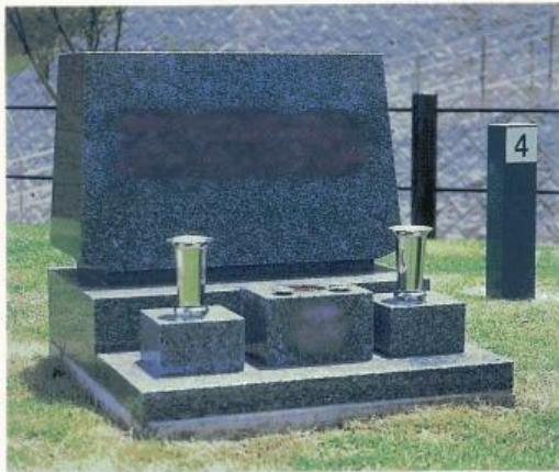
Aタイプ A TYPE grave