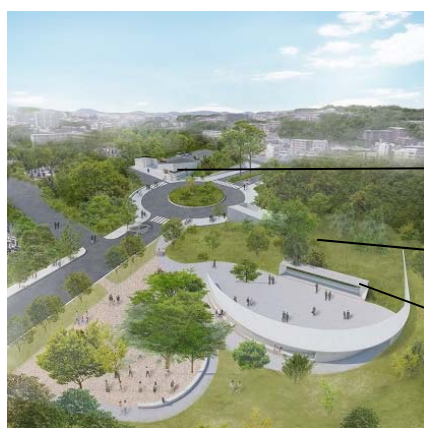
【平尾霊園合葬式墓所全景】（イメージ）